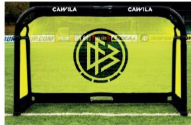
Cawila Aluminium Monitor CORE